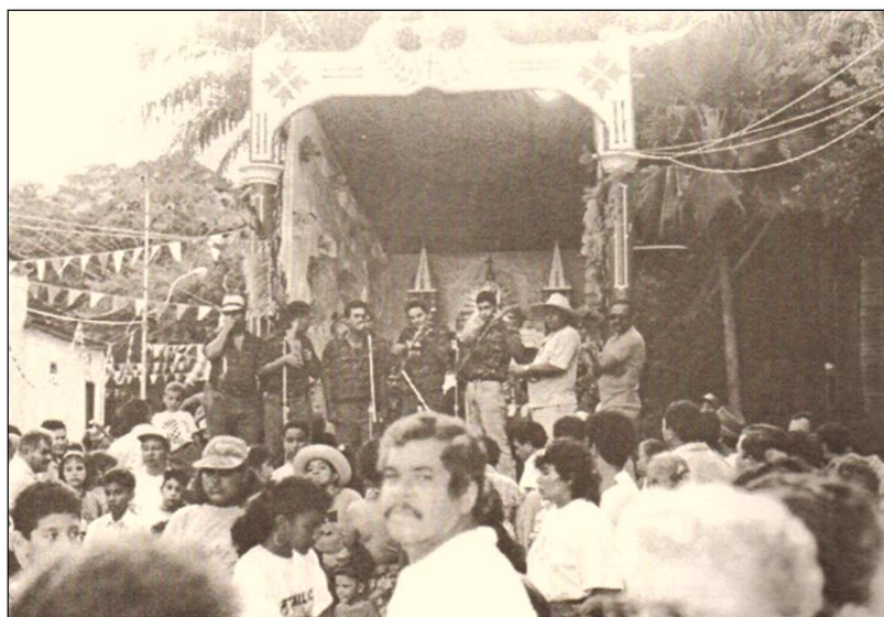
Galerón en El Copey (La Asunción), 1995.

Los galerones efectuados en El Copey (La Asunción), durante la celebración de la Santa Cruz del Copey y en El Mamey (La Asunción), a propósito de las festividades en honor a la Santísima Trinidad, se caracterizan por la presencia de un escenario decorado con ciertos detalles que reflejan la devoción y religiosidad de los habitantes de ambos pueblos. Para detallar un poco más estas particularidades se presentan y analizan algunas fotografías.