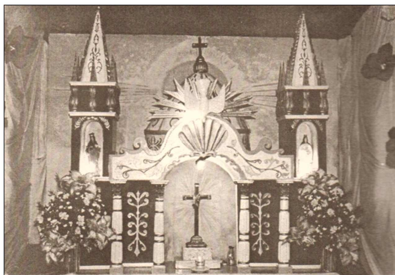
Galerón en El Copey (La Asunción), 1993.