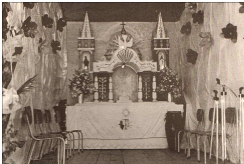
Galerón en El Copey (La Asunción), 1995.