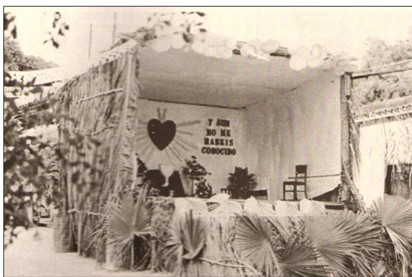
El Mamey (La Asunción), 1994. Escenario en todas sus dimensiones, Foto N° 5: Lic. Teresita González.